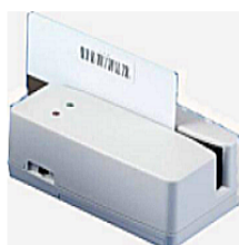
BCR300 L97 x W57 x H40mm